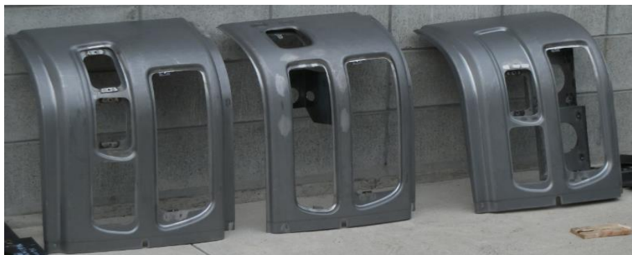
大型車輛関連部材(Fバンパー)

単品加工からロット量産加工まで、幅広く受注対応しております。 また、量産試作時において設計者との、綿密なる打ち合わせを行い、設計時において板金コスト意識に基づいた、提案をさせていただいております。 リードタイムは、新規の物ですと2週間頂いていますが、通常の流れ物においては、10日に対応している物もあります。下記にて当社板金製品のサンプルを一部ご紹介させていただきます。